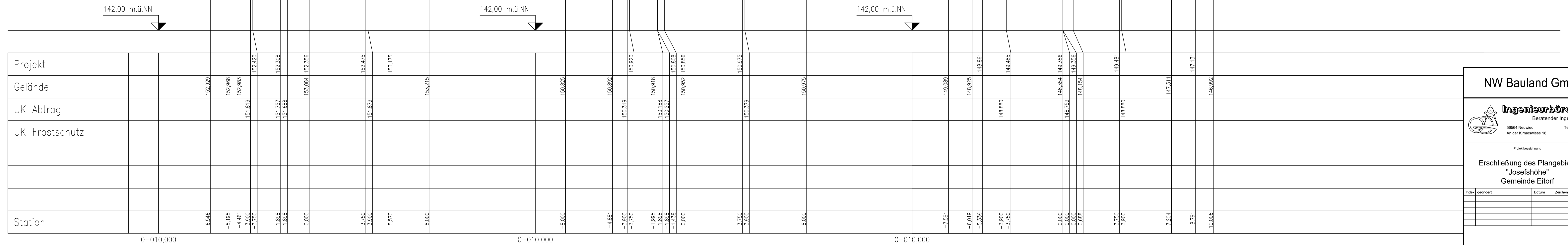
Profil 7 Achse 1 0+150,000